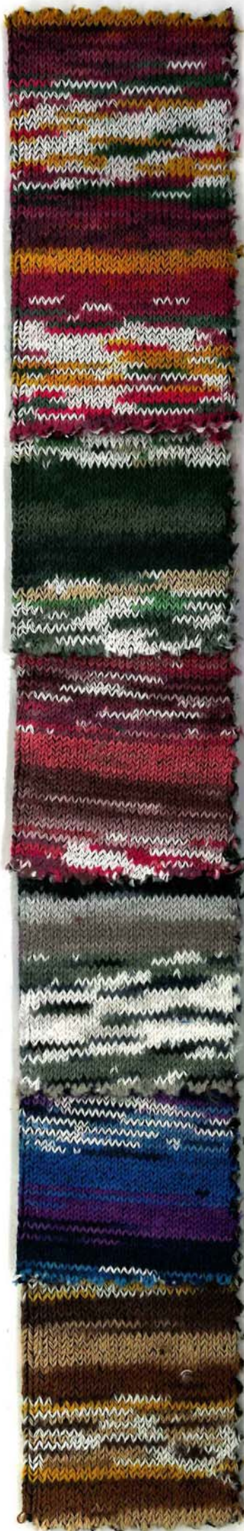
DESIGUAL5 Carioca 1415