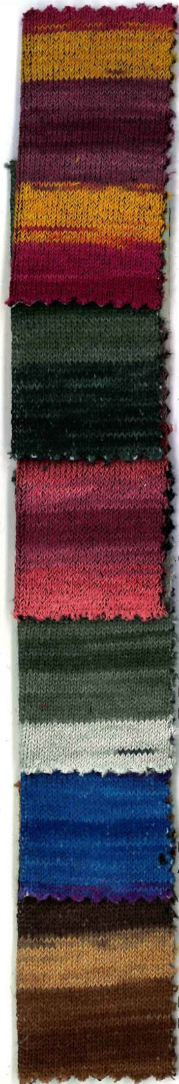
DESIGUAL3 Spagna 1409