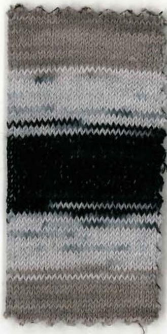
DESIGUAL3 Soldier 1421