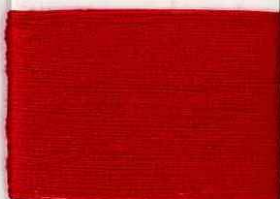
courbet R306 ss *