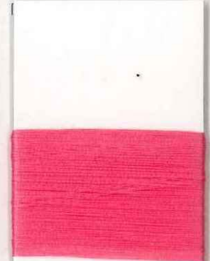
raffaello P205 s *