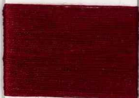
degas R308 ss *