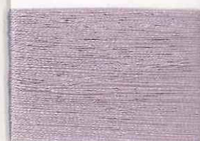
verbena 4207 c