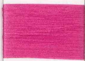
savoldo P206 ss *