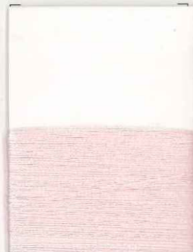
pupa 036 c