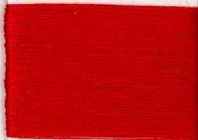
david R307 ss *