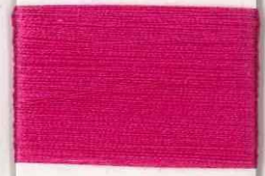
tiempolo P207 ss *