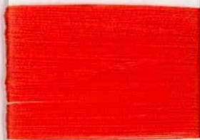
cezanne R303 ss *