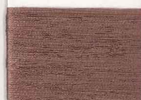
mirra 7107 c