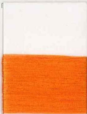
braque R302 ss *