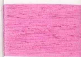
perugino P204 s *