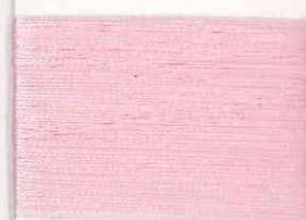
masaccio P201 m *