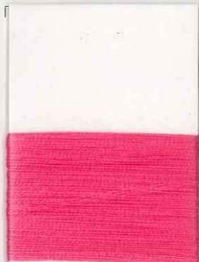
lampone 408 s