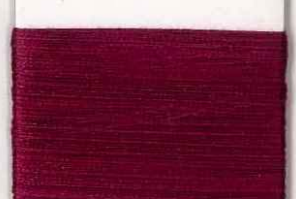
tiziano P208 ss *