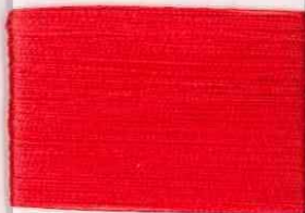
chagall R304 s *