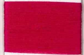
caramella 7507 s