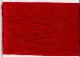
ciliegia 035 s