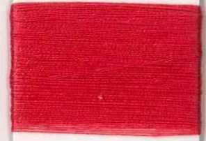
corot R305 s