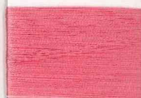
modigliani P203 *