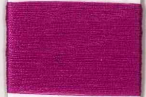
florenzia 0304 s