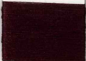
barolo 021 s